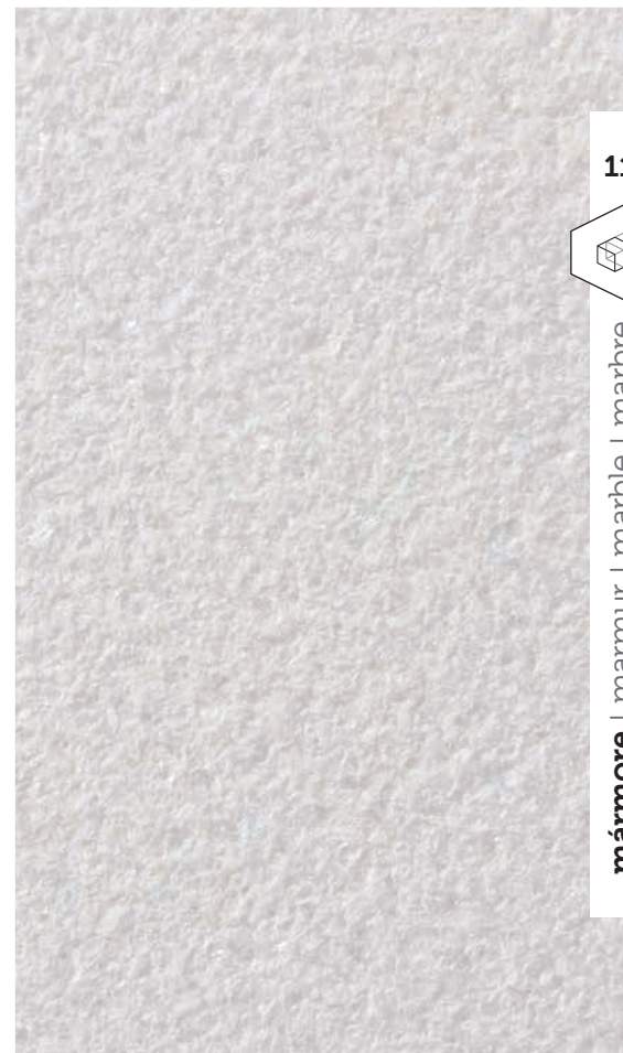
bujardado | kuty | hammered | martelée