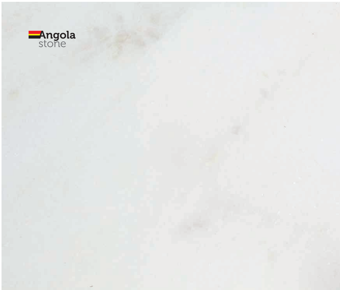
polido | wykończony | polished | poli